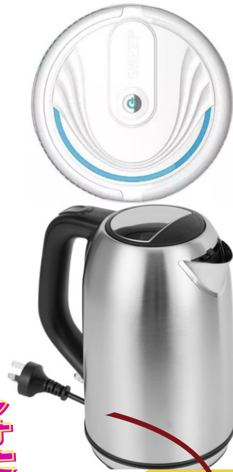
不銹鋼水壺 自動吸塵機