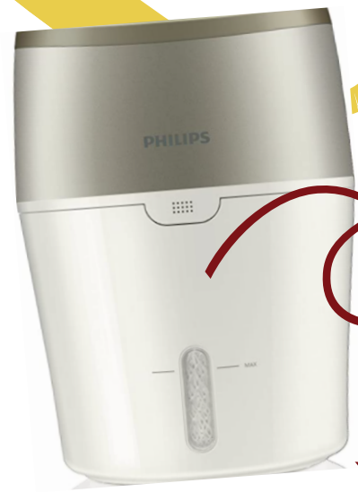
菲利普納米加濕器