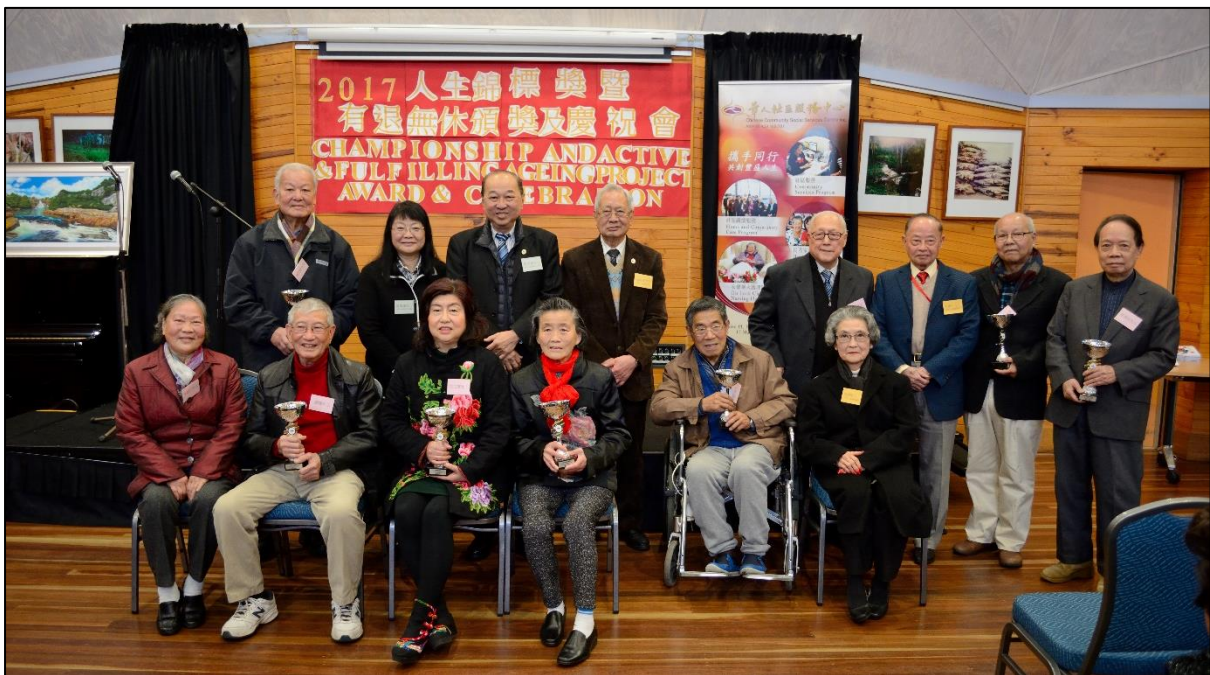
2017 人生錦標獎得獎及入圍者、評選團，以及華人社區服務中心管理委員會成員。